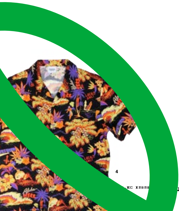
4 EISS NATURE GUIDE